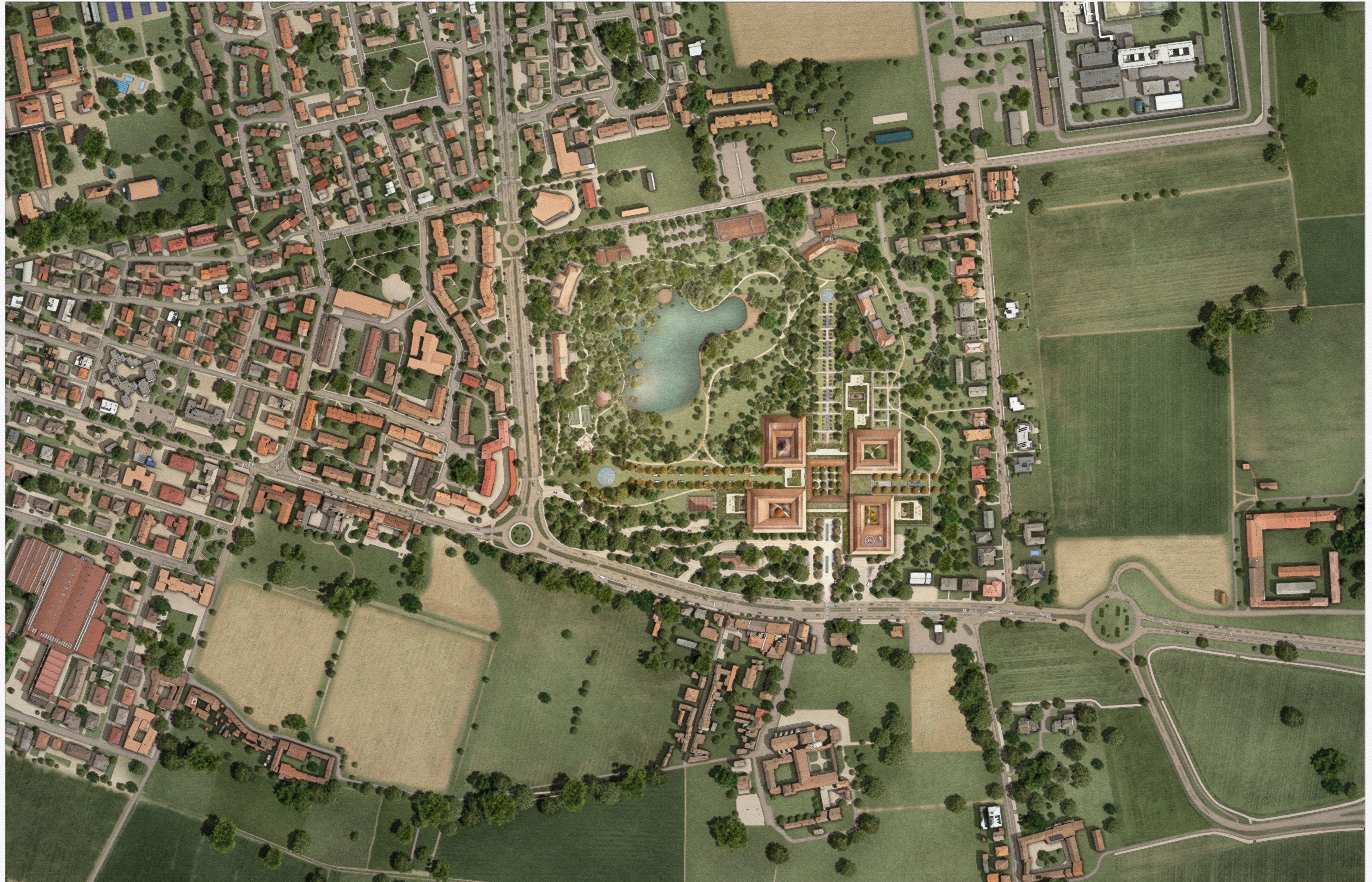
Pianta Area di Progetto 1:2000 - Relazione con la Città

culturale ed ecologico, il parco si trasforma in un luogo di vitalità grazie all'introduzione di nuove funzioni, tra cui una moderna biblioteca, un asilo nido e un centro culturale all'aperto. Inoltre, grazie a un miglioramento dell'accessibilità dei percorsi ciclabili e naturalistici, l'ospedale si evolve in un nuovo hub per la comunità urbana e periurbana. Con l'obiettivo di concretizzare il 'futuro dell'assistenza sanitaria', il nuovo ospedale mette in mostra le più recenti innovazioni e tecnologie, operando in perfetta sinergia all'interno di una più ampia rete di strutture sanitarie territoriali.