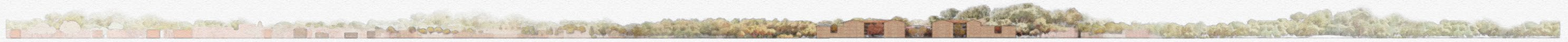
Sezione Urbana 1:2000 - Relazione con la Città'