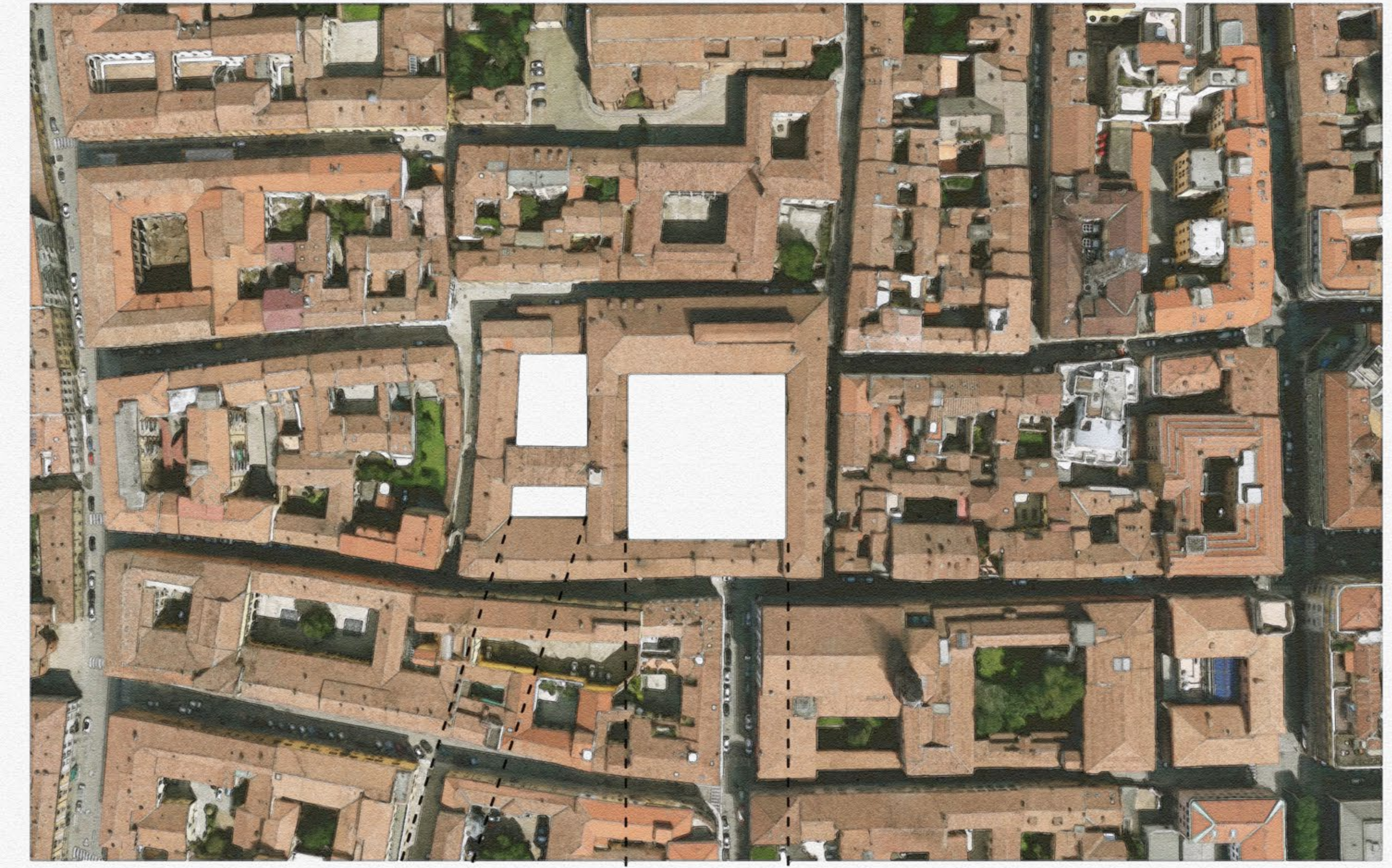
Il tessuto urbano di Cremona